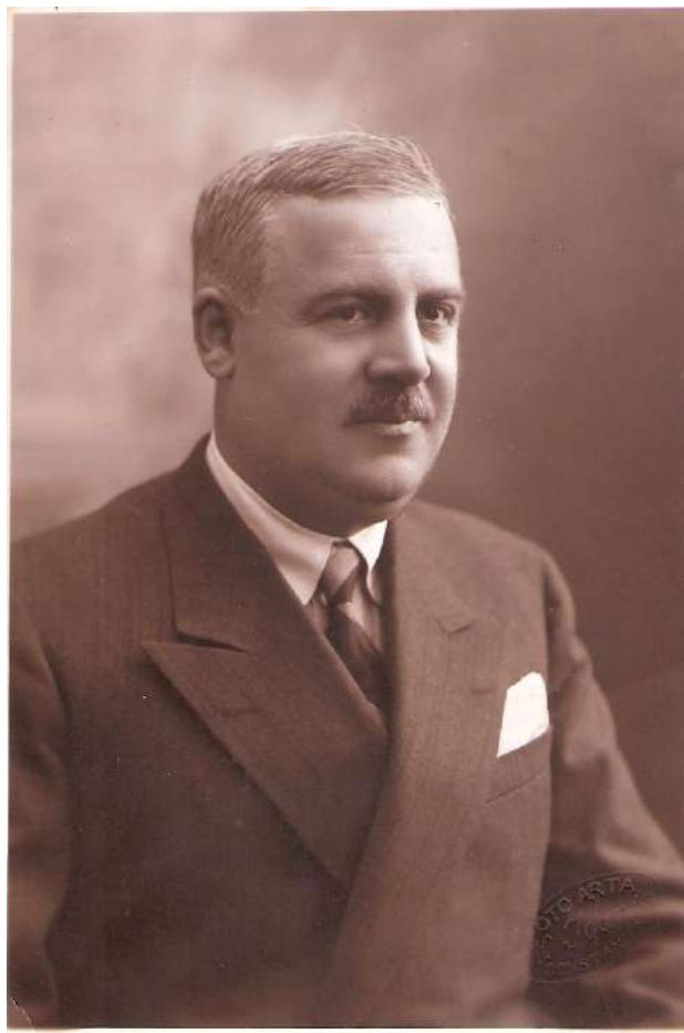
Theodor P. Frangopol logodit 24 ianuarie 1932 nascut la Constanta in 1887- decedat la Constanta in 1955

culoarea apei schimbându-se din verzuie datorită algelor ce le aduceau la mal, cenușie sau albă mai către mal unde spuma valurilor crea o ireală pătură apei mării ce se domolea când atingea nisipul plajei. Panorama naturii dezlănțuite este unică și mai târziu, când revenind la Constanța în concediu, contemplarea mării mă determina să strig, și eu în sinea mea, bucuria și fericirea de a o revedea, thalassa, thalassa (marea, marea) precum au exclamat cei zece mii de soldați ai lui Xenofon care după o retragere de 16 luni au zărit marea.