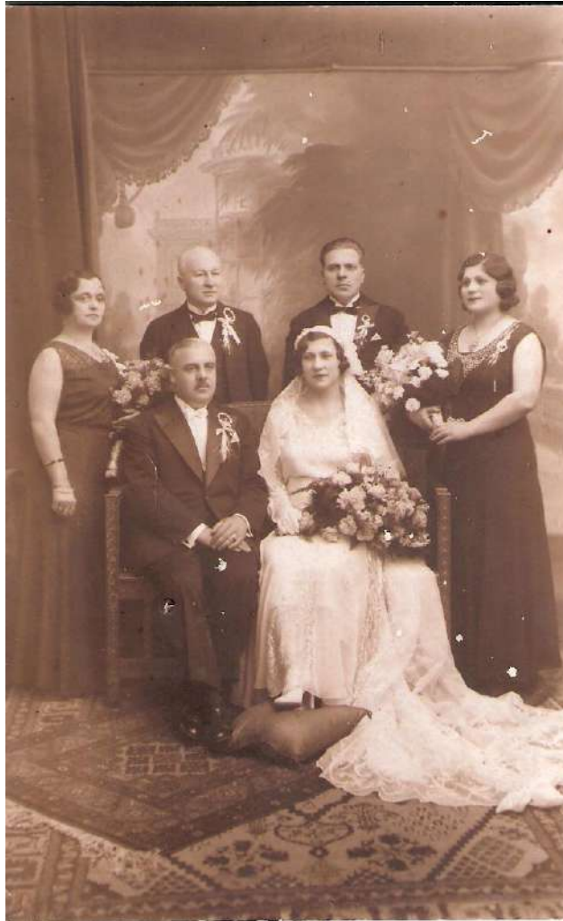
Poza de la casatorie 1932